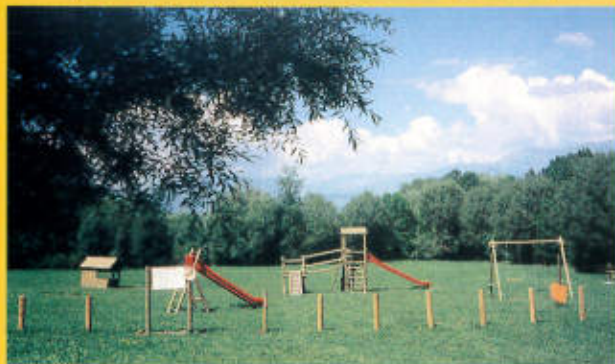
Espace jeux - 1 ère étape du projet