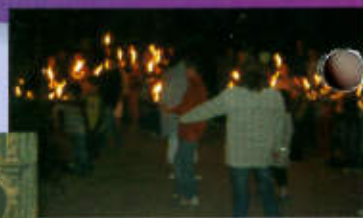
Feux de la Saint-Jean et de la Saint-Pierre