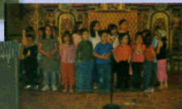
Chorale des enfants