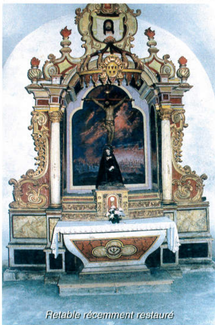
Retable récemment restauré

Un tronc a été placé sur le pilier entre les deux chapelles de gauche à l'intention des généreux donateurs.