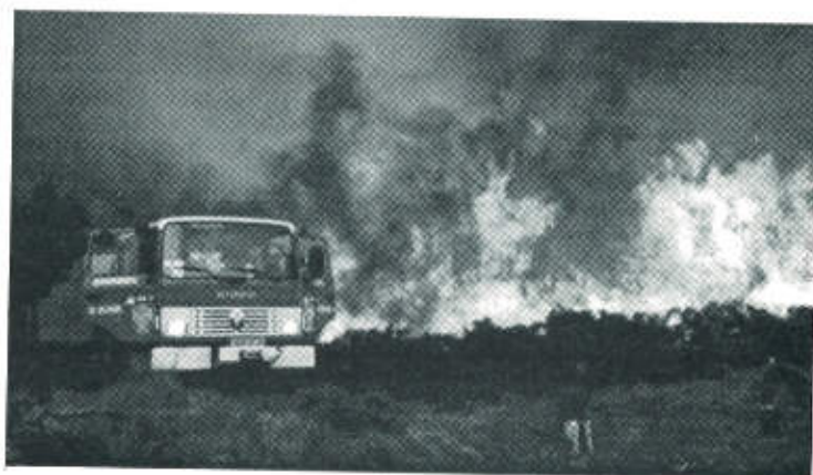
Le C.C.F.M. en action sur le feu d'Estavar le 30.03.96